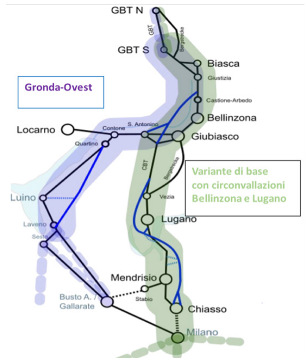
Completamento di AT con le varianti